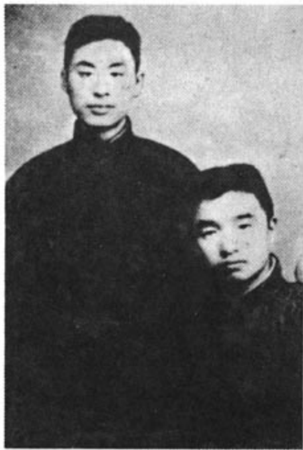
和叶圣陶先生1921年12月31日摄于杭州