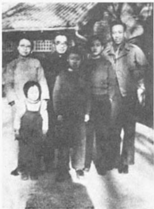
与夫人、子女在清华园（1947年）