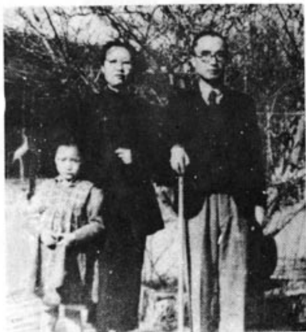
与夫人、女儿摄于北京颐和园（一九四八年）