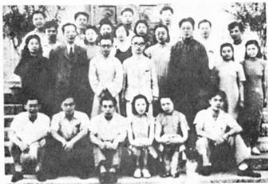
1948年回清华大学中文系师生合影