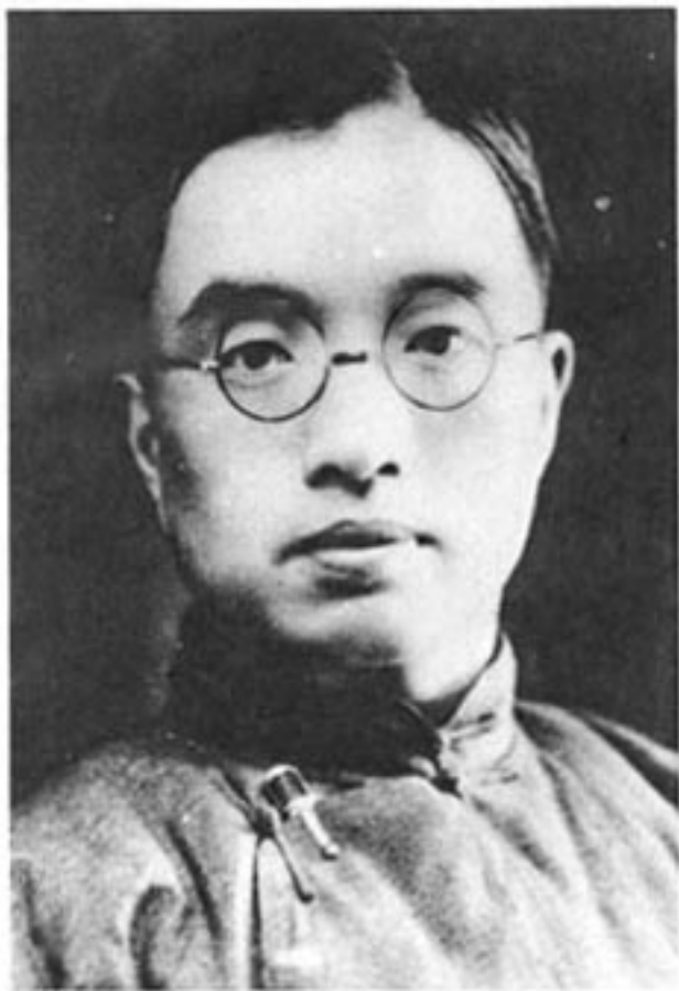
朱自清先生（摄于20年代）