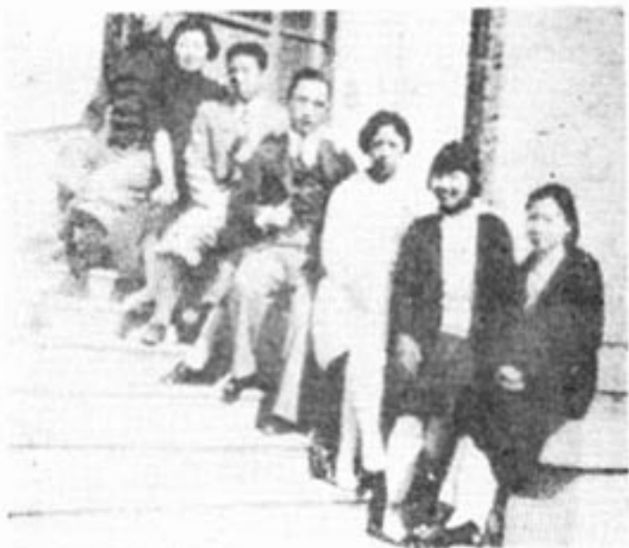
1932年，与夫人（右一）及友人摄于清华图书馆门口