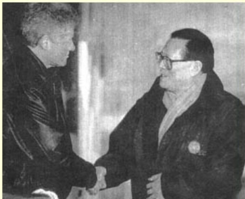
(图10) 1994年，江泽民与克林顿在西雅图会晤。