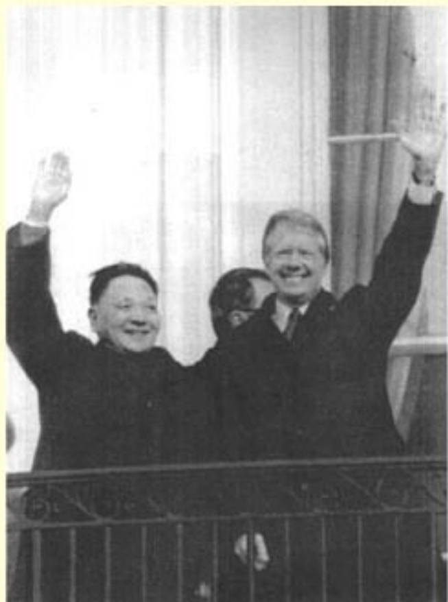
(图6) 1979年1-2月 邓小平访美,受到卡特 总统的欢迎。