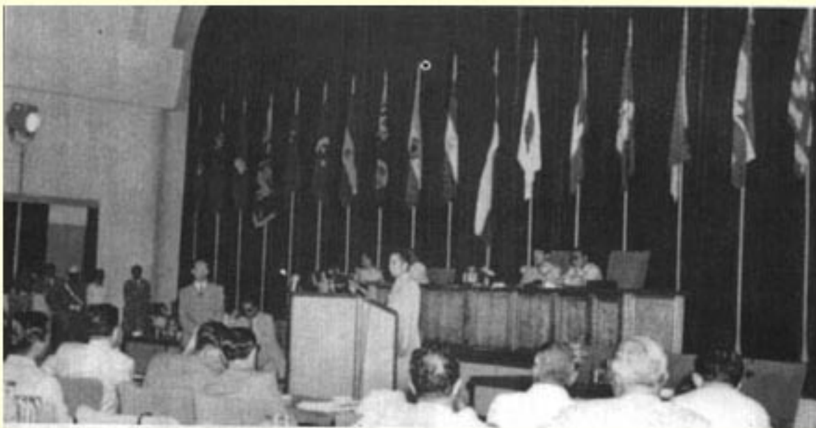
(图3) 1955年5月, 周恩来总理在万隆会议上发言。这次会议诞生了中国等国倡导的和平共处五项原则。