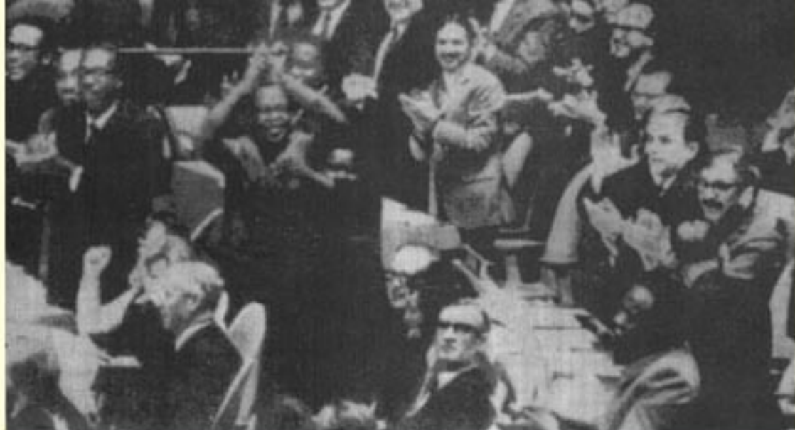
(图5) 1971年10月25日,第26届联合国大会恢复中国合法席位。