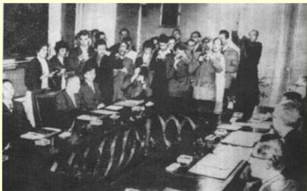
(图4) 1958年,中美华沙大使级会谈。