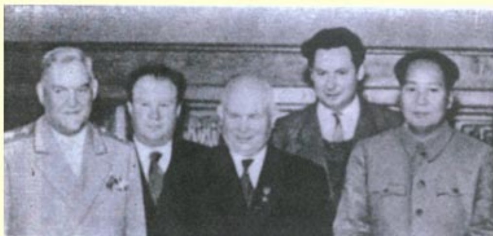
1954年苏共中央第一书记赫鲁晓夫（前左二）和苏联部长会议主席布尔加宁（前左一）访问中国时与中共中央主席毛泽东的合影。