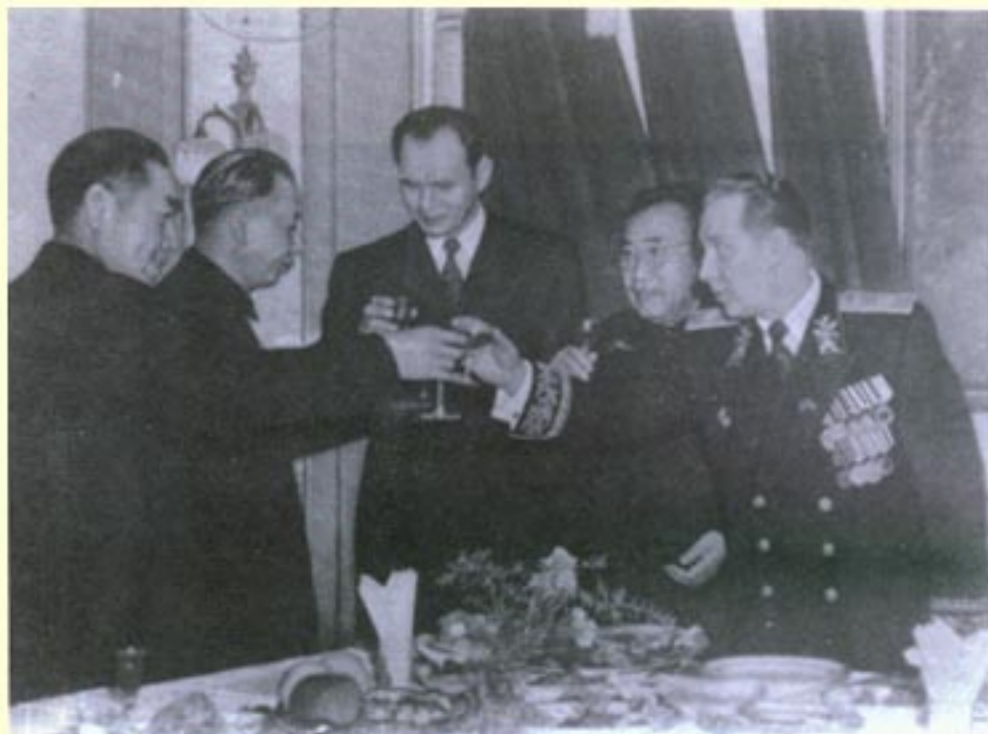
1952年2月，为纪念中苏友好同盟互助条约签订二周年，苏联驻中国大使罗申于2月24日在苏联中国大使馆举行酒会。图为朱德、刘少奇、周恩来与罗申等在为中苏两国人民的友谊干杯。