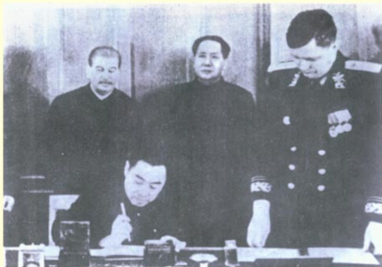
1950年2月毛泽东、斯大林出席在莫斯科举行的《中苏友好同盟互助条约》的签字仪式