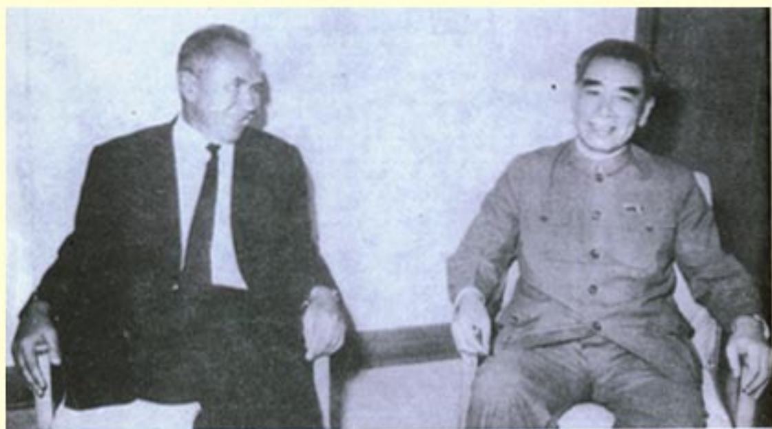
1969年9月，周恩来总理在北京机场会见苏联部长会议主席柯西金。