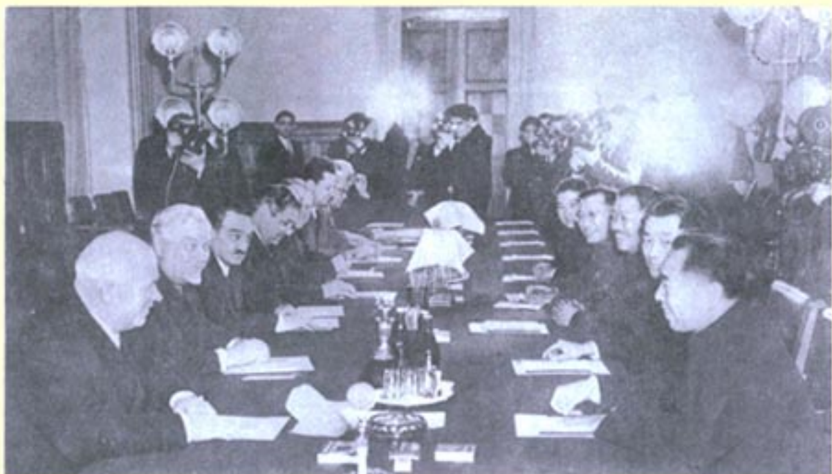
1957年1月中国总理周恩来率领中国政府代表团访问苏联，在克里姆林宫与赫鲁晓夫（左一）等苏联领导人举行会谈。