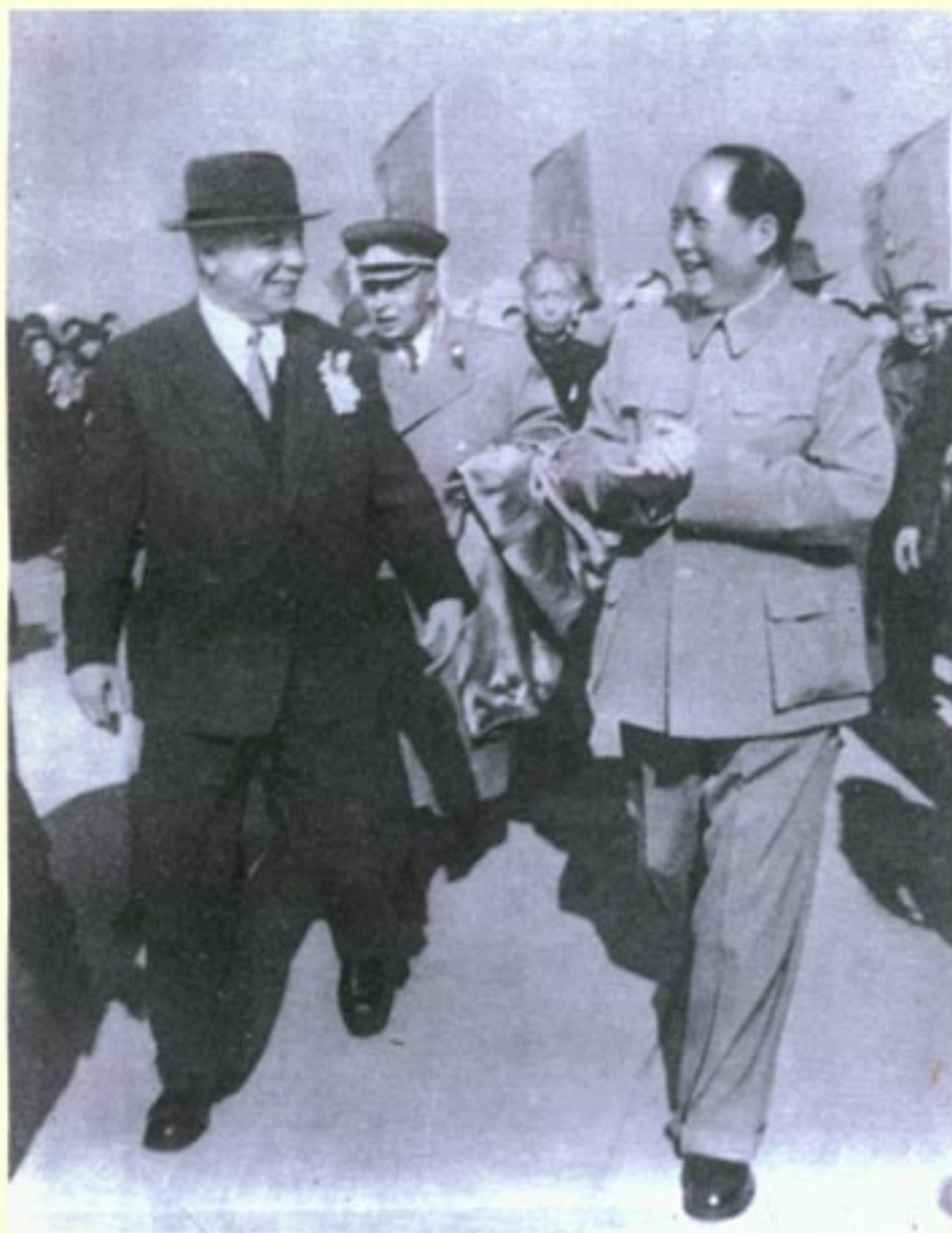
1957年苏联最高苏维埃主席团主席伏罗希洛夫应毛泽东主席邀请访问中国。 图为毛泽东欢迎伏罗希洛夫。