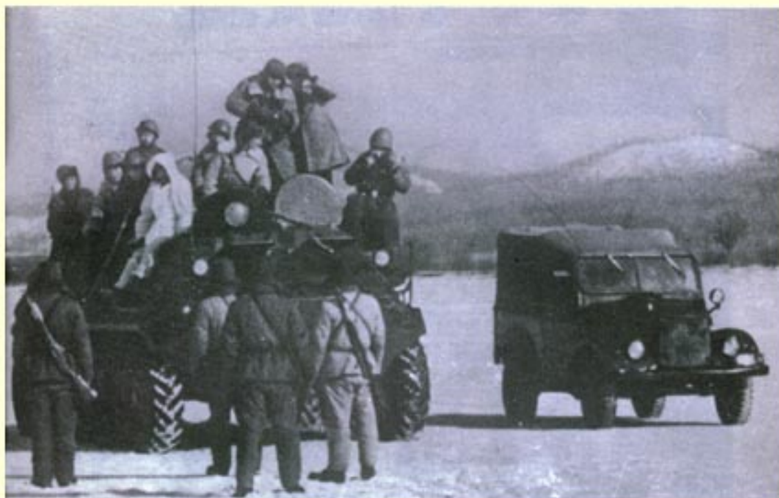
1969年发生中苏珍宝岛冲突事件。图为中国边防战士阻挡苏军装甲车进入珍宝岛。中国边防战士与苏联边防军士兵在争执。